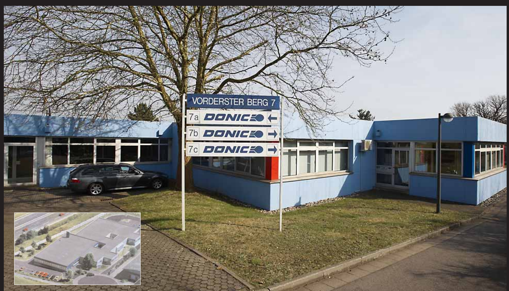
Die DONIC Firmenzentrale in Völklingen (Deutschland).