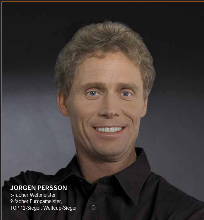
JÖRGEN PERSSON 5-facher Weltmeister, 9-facher Europameister, TOP 12-Sieger, Weltcup-Sieger