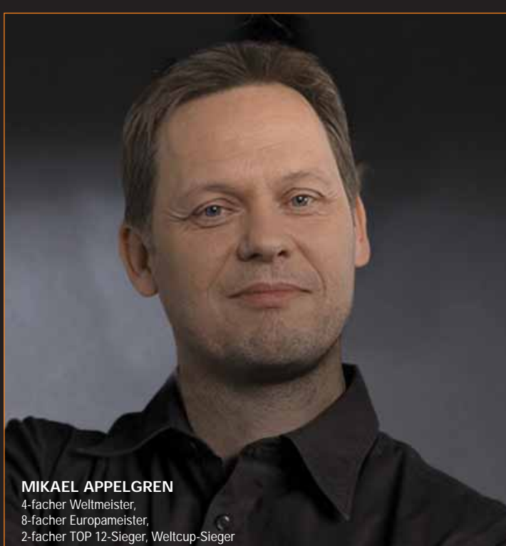
MIKAEL APPELGREN 4-facher Weltmeister, 8-facher Europameister, 2-facher TOP 12-Sieger, Weltcup-Sieger